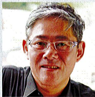
フォトグラファー ビデオグラファー